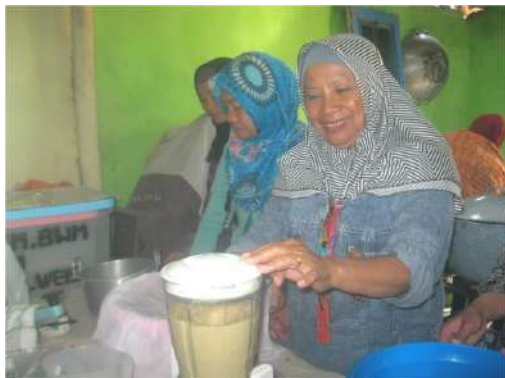
Gambar 2. Pelatihan proses produksi jahe instan

Hasil pelatihan adalah pengetahuan dan ketrampilan dalam bidang boga terutama dalam pengolahan jahe dengan diolah menjadi berbagai macam produk-produk seperti jahe serbuk (jahe instan), jahe kering dan sirup jahe dengan nilai jual yang lebih tinggi. Berdasarkan materi yang telah disampaikan, maka para peserta sudah dapat membuat produk jahe sesuai dengan prosedur dan materi yang telah disampaikan dan segera akan mewujudkan langkah-langkah untuk mengembangkan kewirausahaan.