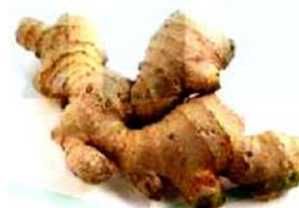
Gambar 1. Rimpang Jahe

Jahe merupakan tanaman tahunan, berbatang semu dengan tinggi antara 30 – 75 cm. Berdaun sempit memanjang menyerupai pita, dengan panjang 15 – 23 cm, lebar lebih kurang 2,5 cm, tersusun teratur dua baris berseling. Tanaman jahe hidup merumpun, beranak-pinak, menghasilkan rimpang, dan berbunga. Bunga berupa malai yang tersembul pada permukaan tanah, berbentuk tongkat atau bulat telur, dengan panjang lebih kurang 25 cm. Mahkota bunga berbentuk tabung, dengan helaian agak sempit, tajam, berwarna kuning kehijauan. Rimpang jahe memiliki bentuk yang bervariasi, mulai agak pipih sampai bulat panjang, dengan warna putih kekuning-kuningan hingga kuning kemerah-merahan. Di Indonesia, jahe dikenal dengan beberapa nama anantara lain halia , haliya , lea , lia , lahia , jhaj , jahi , jhahik , moyuman , beuing , hairale , masin manas , reja , pimedas , jahja , padeh , sipode , sipadas , pege , bahing , ai manas , naije , sedap , sehi , sewe , laie , gore , gisoro , gihori , dan yoyo .