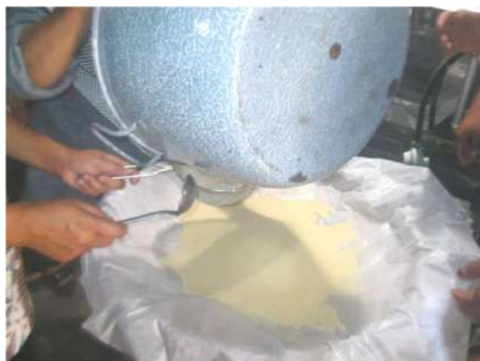
Gambar 3. Hasil pengolahan jahe menjadi serbuk