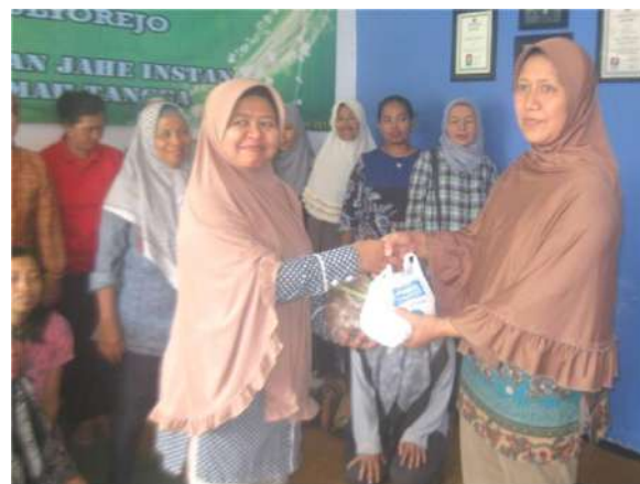
Gambar 4. Peserta latihan mendapatkan hasil jahe instan