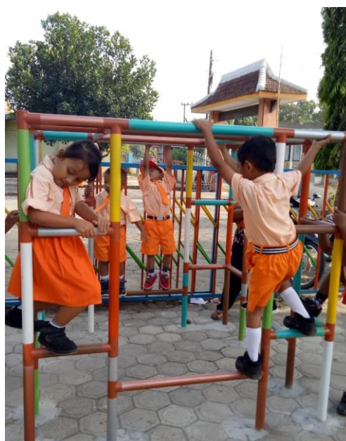
Gambar 3. Siswa TK