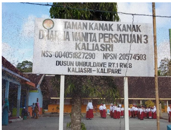
Gambar 1. Lokasi PKM