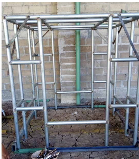
Gambar 2. Tack weld