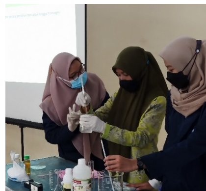
Gambar 5 Antusiasme masyarakat mencoba membuat produk