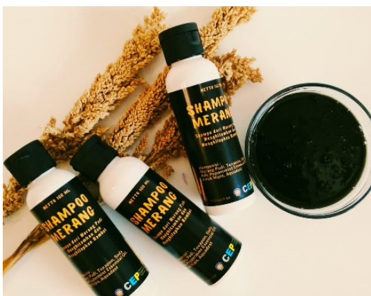
Gambar 2 Hasil sampo merang padi

Pelaksanaan kegiatan Pengabdian pada masyarakat dilaksanakan pada tanggal 11 September 2021 di Balai RW 04, Kelurahan Tasikmadu Kecamatan Lowokwaru dengan memperhatikan protokol kesehatan selama kegiatan. Peserta mendapatkan starter kit untuk protokol kesehatan seperti masker 3 ply, masker kain, hand sanitizer , tisu basah, face shield (pelindung wajah) serta ATK seperti buku, bolpoin serta hardcopy materi untuk dipelajari. Para peserta juga mendapatkan berbagai