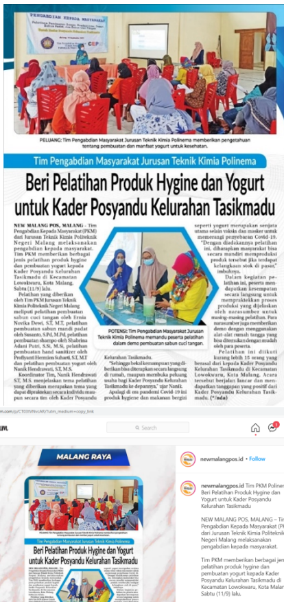
Gambar 8 Tampilan publikasi media masa online di New Malang Pos

Kegiatan pengabdian pada masyarakat dipublikasi pada media massa secara online pada salah satu media masa ternama di kota Malang yaitu New Malang Pos pada tanggal 15 September 2021 dengan link https://newmalangpos.id/tim-pkm-polinema-beripelatihan-produk-hygiene-dan-yogurt-untuk-kader-posyandu-kelurahan-tasikmadu (tampilan publikasi pada Gambar 8) dan juga media sosial instagramnya yaitu, https://www.instagram.com/p/CT03tVNvcAR/?utm_medium=coppy_link (tampilan publikasi pada Gambar 8).