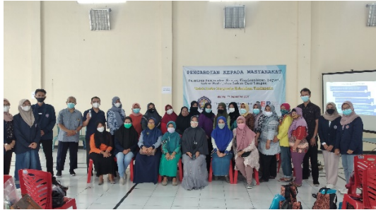
Gambar 6 Dokumentasi bersama para peserta dan mahasiswa

Kemudian dilanjutkan pemaparan materi dan demonstrasi pembuatan sampo merang padi.