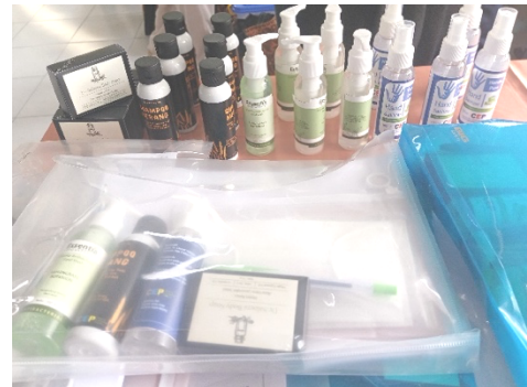
Gambar 3 Seminar kit dan produk PPM untuk eserta PPM Kelurahan Tasikmadu

produk hasil buatan anggota PPM Teknik Kimia Polinema seperti sabun cair, sabun mandi padat, sampo merang padi, hand sanitizer dan yogurt.