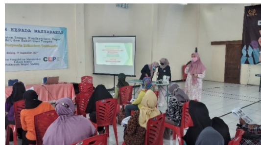
Gambar 4 Pemberian materi dan demonstrasi pembuatan produk