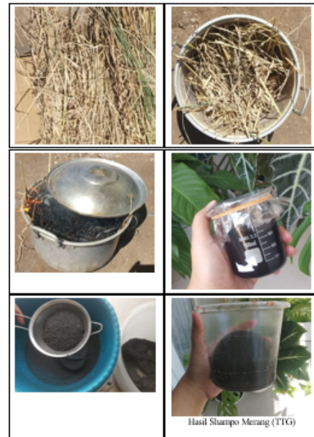
Gambar 1 Produksi sampo merang padi

memasuki lokasi, pengkondisian jumlah dosen dan mahasiswa yang hadir dan mengatur agar kegiatan dilakukan tanpa membuat kerumunan dan keramaian.