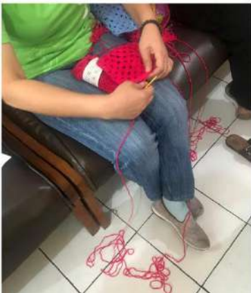
Gambar 18: Proses Belajar Membuat Granny Square ketika Khalayak Sasaran Melakukan Kesalahan (Benang harus diurai kembali)