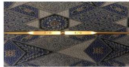
Gambar 1 : Hook / HakPen / Hakken

Square Pattern kali ini hakpen yang digunakan adalah no 7/0 menyesuaikan dengan jenis benang yang dipakai.