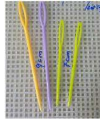
Gambar 8 : Aneka Jarum Rajut

biasanya terbuat dari bahan plastik sehingga ketika kita gunakan tidak akan merusak benang rajut. Jarum sulam berfungsi sebagai alat untuk menggabungkan masing-masing potongan Granny Square yang telah dihasilkan menjadi bentuk yang kita inginkan.