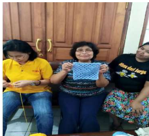
Gambar 14 : Pelaksanaan Pelatihan Merajut Hari ke -1

*) Pada pertemuan ke 2, praktek ditambah dengan materi menyambung masing-masing potongan granny square .