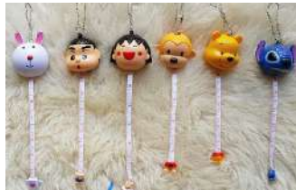
Gambar 6 : Aneka Meteran untuk Mengukur Produk Akhir Rajutan

Meteran kain digunakan untuk mengukur masing-masing potongan rajutan Granny Square yang dihasilkan, karena masing-masing ukurannya harus sama supaya tidak menimbulkan masalah ketika nantinya akan disambung menjadi satu. Selain itu digunakan juga untuk mengukur produk akhir yang akan dihasilkan.