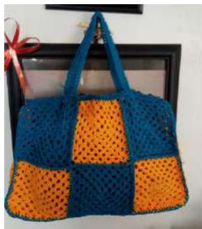
Gambar 13 : Pengembangan Hasil Akhir Gabungan Granny Square dalam bentuk Tote Bag