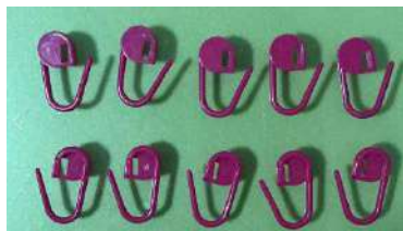
Gambar 7 : Aneka Penanda Rajutan ( Stitch Marker )

Alat penanda rajutan juga bisa digunakan ketika kita menyambung benang yang habis atau mengganti warna benang rajutan dengan warna lain sehingga rajutan kita sebelumnya tetap aman.