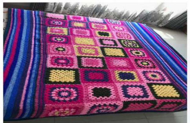
Gambar 12 : Hasil Granny Square Setelah digabungkan dalam bentuk Bed-Cover

Potongan-potongan Granny Square yang dihasilkan bisa digabungkan dengan berbagai macam pilihan cara. Sebagian perajut suka menyambungkannya dengan cara menjahitnya dengan benang jahit, sebagian lagi menyukai menyambungkannya dengan cara merajutnya bersamaan dengan menggunakan sistem rajutan tunggal atau jahitan selip. Salah satu tampilan hasil akhir granny square yang telah digabungkan dapat dilihat pada gambar 9 dibawah ini dalam bentuk bed cover .