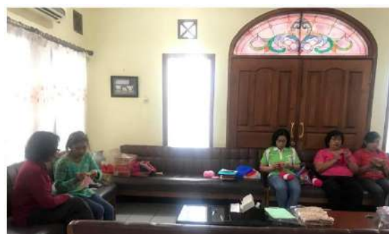
Gambar 15 : Suasana Pelatihan Merajut Hari ke -