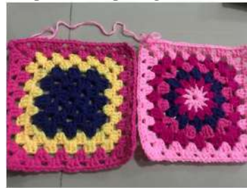
Gambar 11 : Modifikasi Pattern Granny Square Hasil Karya Khalayak Sasaran

Selain itu, pattern lingkaran tengah juga telah berhasil dimodifikasi dari bentuk dasar granny square menjadi bentuk matahari. Kedua modifikasi tersebut diatas dapat dilihat pada gambar 8 dibawah ini.