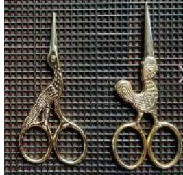
Gambar 5 : Aneka Gunting untuk Benang Rajut

Gunting digunakan untuk memotong benang rajut yang digunakan dan merapikan hasil rajutan setelah proyek selesai.