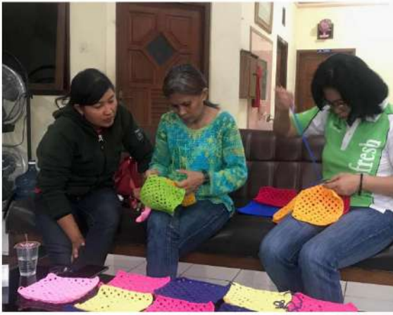
Gambar 17 : Praktek Menggabungkan Granny Square