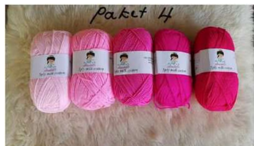
Gambar 2 : Benang Rajut Anabelle Ply 5 Seri Merah

Contoh variasi seri warna benang rajut yang dibagikan pada khalayak sasaran antara lain dapat dilihat pada gambar 2 dibawah ini.