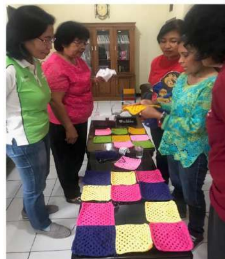
Gambar 16 : Pendampingan Melekat oleh Fasilitator