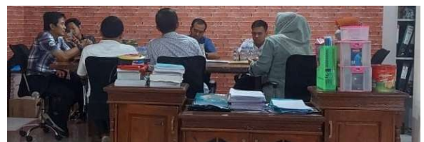
Gambar 1. Penyuluhan materi green energy berbasis rooftop solar photovoltaic

Penyuluhan materi kepada pihak UMKM Maju Lancar Kota Madiun yang dilaksanakan pada tanggal 18 November 2021. Kegiatan penyuluhan materi dilaksanakan secara langsung di UMKM Maju Lancar.