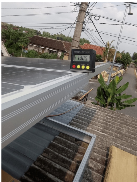
Gambar 2. Pemasangan modul photovoltaic monocrystalline 3x100Wp

Pelatihan pemasangan rooftop solar photovoltaic dilaksanakan pada tanggal 27 November 2021. Rooftop solar photovoltaic yang dipasang di UMKM menggunakan modul photovoltaic monocrystalline dengan kapasitas 3x100Wp. Sistem ini dilengkapi dengan baterai tipe VRLA sebesar 2x100Ah yang digunakan sebagai penyimpanan energi listrik. Sehingga sumber energi listrik yang dihasilkan oleh PLTS dapat digunakan untuk mensuplai beban pada saat malam hari.