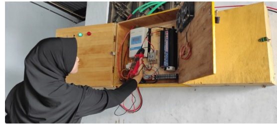
Gambar 3. Pemasangan panel Kontrol PLTS Rooftop

kegiatan UMKM tidak akan terganggu ketika terjadi pemadaman sumber energi listrik PLN.